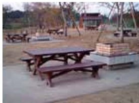
秋葉の森総合公園(ピクニック広場)