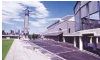
彩の国さいたま芸術劇場