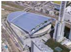
さいたまスーパーアリーナ