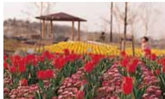
大宮花の丘農林公園