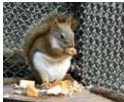
大宮公園(小動物園)