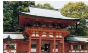
武蔵一宮氷川神社