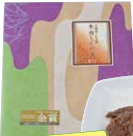
岩槻城下町名物 牛肉しくれ煮 ¥2100 (170g)

④1868年創業の老舗店。一級酒の吟醸粕4~5種をブレンドし、コクとまろみがあり歯ごたえ抜群。下記で販売。 製造元/酒井甚四郎商店☎048-822-2110