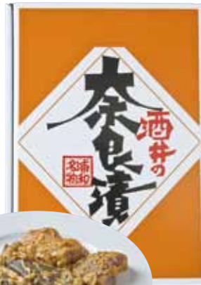
酒井の奈良漬 ¥2100 (630g・瓜1、胡瓜2、 生姜1、茄子1)

④さいたま市緑区野田地域にかつて飛来した白鷺をイメージした口溶けのよい和菓子。抹茶味、珈琲味なども。下記で販売。 製造元/浦和花見☎048-822-2573