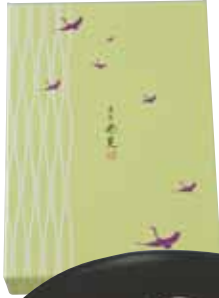
石炭あられ ¥630 (80g)

④甘味があり、渋味の少ない口当たりの良さが狭山茶の特徴。美しい絵柄にも注目して。ルミネ大宮店などで販売中。 製造元/信濃屋☎048-661-5555