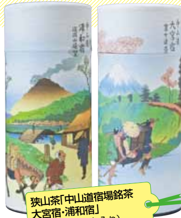
狭山茶「中山道宿場銘茶 大宮宿・浦和宿」 ¥3150 (85g×2缶入り)

④「シャンソニエ菓子工房」と「バンビーナバンビーノ」のケーキコーナーで販売。宇治の抹茶が香り口溶けも◎。 製造元/シャンソニエ菓子工房 ☎048-857-8801