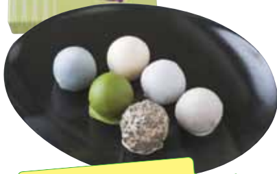
ほくろぼう 白鷺宝詰合せ12コ入り ¥1250 (12個入)

④さいたま市緑区野田地域にかつて飛来した白鷺をイメージした口溶けのよい和菓子。抹茶味、珈琲味なども。下記で販売。 製造元/浦和花見☎048-822-2573