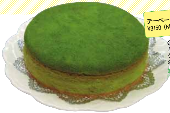
テーブル(抹茶ケーキ) ¥3150 (6号)

「さいたま推奨土産品」に認定されたみやげ品から平成21・22年度の金賞受賞商品が決定。厳しい審査を経て選ばれた、味に自信ありの全8商品を紹介。さいたま市のおみやげならコレ！