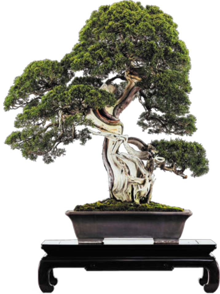
樹種：真柏 幹：寿雲 シャリ（白骨化した幹）ガッコイイ（さいたま市大宮盆栽美術館収蔵）

1990年大阪府生まれ。関西学院大学卒業。面白法人カヤック勤務。日本初の盆栽情報発信するウェブメディア SEKAI BONSAI 運営。盆栽は育てるより、見る派。