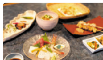
陶器 名物はご主人自慢の焼き鳥。自家菜園で採れたニンニクや玉ねぎを使って作った特製味噌は焼き鳥とよく合う。ビールが何杯でもいける味。さいたま市桜区町会 4-16-15 ☎048-838-2969 不定休

さいたま市浦和区仲町 2-16-15 ATビル 1F ☎048-789-6834 月曜・第3火曜定休