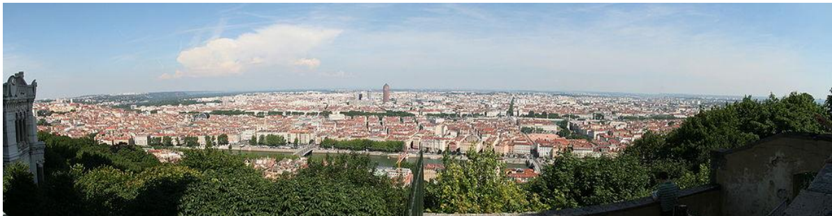
Lyon is France's third largest city.

Date/Time: December 20 (Thu) 16:00-18:00