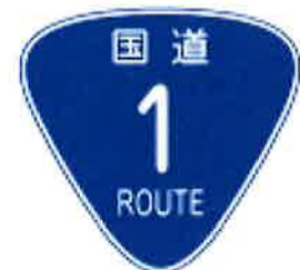
Número de carretera