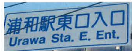
Letrero en cruce