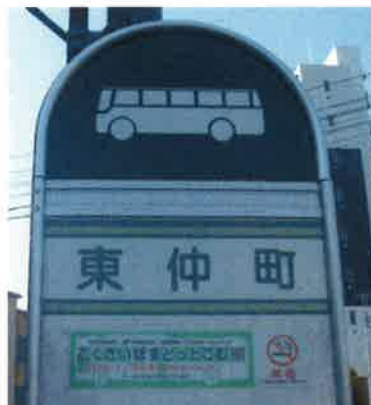
Parada de autobús