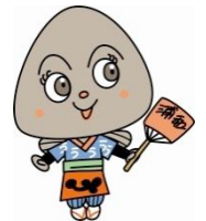
浦和うなこちゃん ©やなせたかし