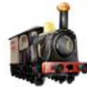
150 形式蒸気機関車型フィギュア