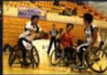
写真は、埼玉ライオンズの選手たち