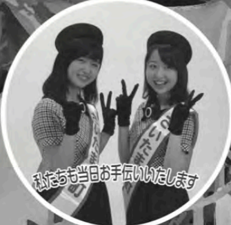
私たちが当日お手伝いいたします