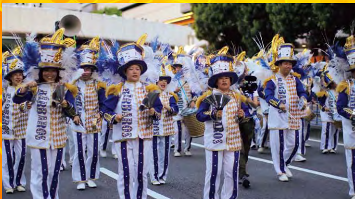
第32回 スパークカーニバル