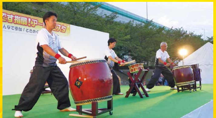
好きです指扇! アートフェスタ & 第49回 指扇まつり大会