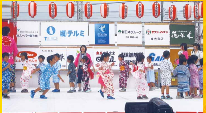
第23回 東大宮サマーフェスティバル