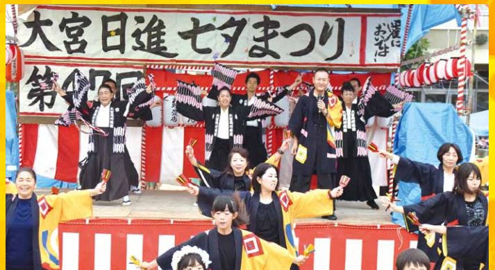
第48回 一愛においでよ一大宮日進七夕まつり 2019