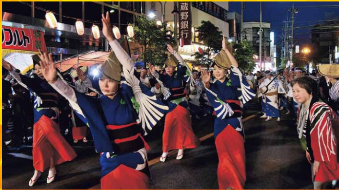
第28回 中山道みやはらまつり 2019