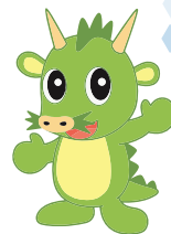
さいたま市 PR キャラクター つなが竜ヌウ