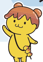
秩父市イメージキャラクター ポテくまっし