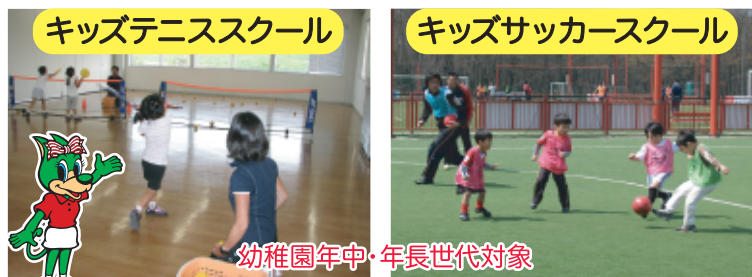
キッズテニススクール