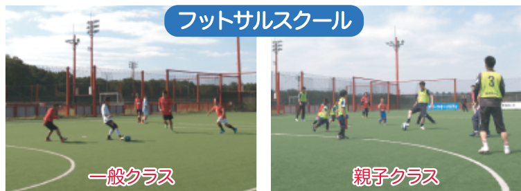
フットサルスクール