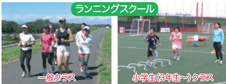
ランニングスクール